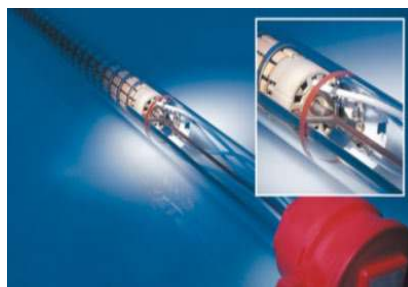
Sicherheitsbadwärmer ROTKAPPE® mit integriertem Anti-Brand-System

Mit prinzipieller Beibehaltung der elektrischen Heizungstechnik, wobei diese durch Heizungen mit integriertem Sicherheitssystem, wie dem Antibrand-system der Sicherheitsbadwärmer ROTKAPPE®, realisiert wird. Ein im Tauchrohr eingebauter Temperaturbegrenzer schaltet die Heizung beim Erreichen gefährlich hoher Tauchrohr-temperaturen dauerhaft ab, und verhindert somit den Brand von Kunststoff-behältern.