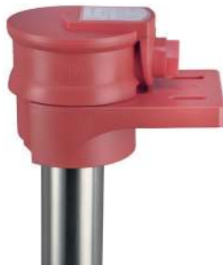
Winkelbadwärmer mit Halter HWB

Die Winkelbadwärmer ROTKAPPE setzen sich aus dem beheizten waagrechten Tauchrohr mit Longlife-Heizeinsatz, dem unbeheizten senkrechten Tauchrohr, dem Klemmgehäuse und der Leitung zusammen.