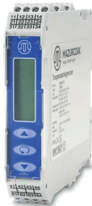
Limiteur de température ETB 200

Le limiteur de température agréé par le TÜV selon la norme DIN EN 14597, en association avec notre sonde de température certifiée TF 24-160/SMG00-M, présente un système de limitation de